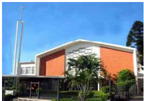
Igreja N. Sra. do Rosário de Pompéia